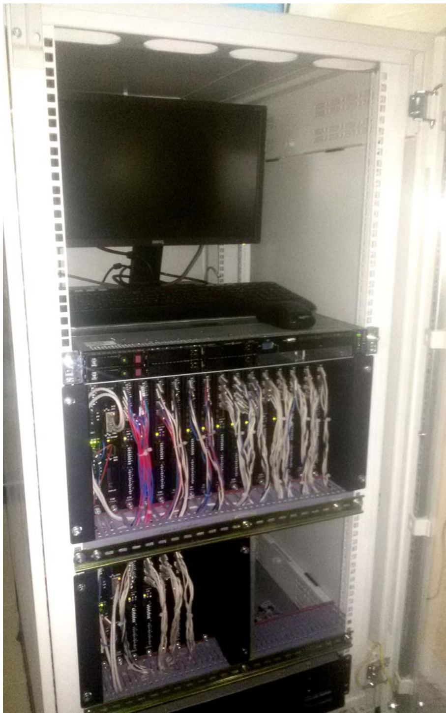
Рисунок 2 - Общий вид шкафа вибродиагностики