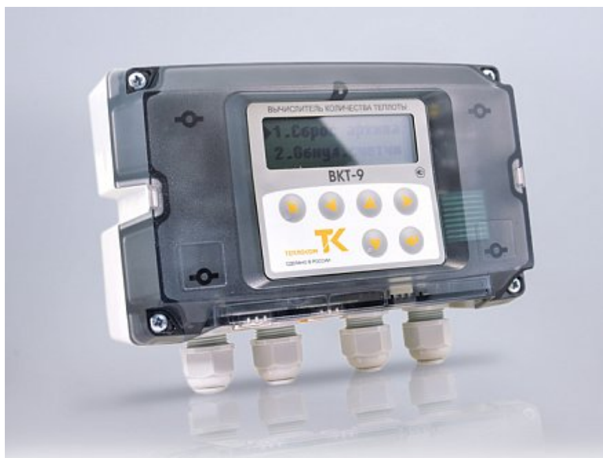
Рисунок 1 - Вычислитель количества теплоты ВКТ-9

Общий вид составных частей теплосчетчиков приведен на рисунках 1-5.