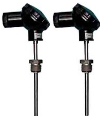
КТПТР-04, KTPTR-05, КТПТР-05/1