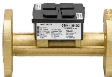
Sono 1500 CT