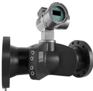
Рисунок 1 - Общий вид расходомеров-счетчиков жидкости ультразвуковых Sentinel LCT4

Схема пломбировки от несанкционированного доступа, обозначение места нанесения знака поверки представлены на рисунке 2.