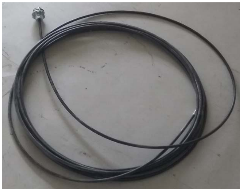
Рисунок 3 - Общий вид термоподвесок

Проектная компоновка (состав), место установки термоподвесок и заводские номера компонентов системы, установленной на элеваторе № 1, приведены в таблице 1.