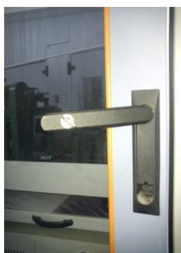
Рисунок 6 - Внешний вид замка на дверце стойки управления