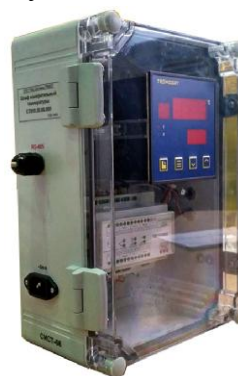
Рисунок 3 - шкаф измерительный температуры