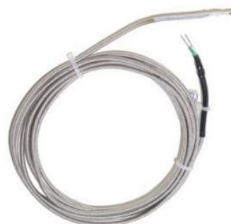
Рисунок 5 - Термометр сопротивления ТС742С