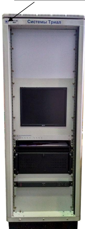
Рисунок 1 - Стойка управления