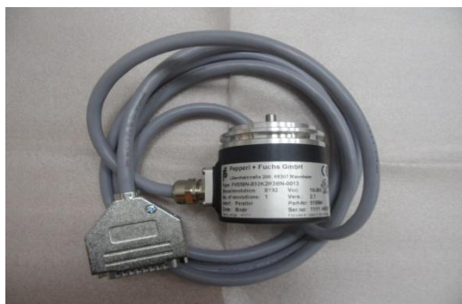
Рисунок 4 - Датчик угла FVS58N