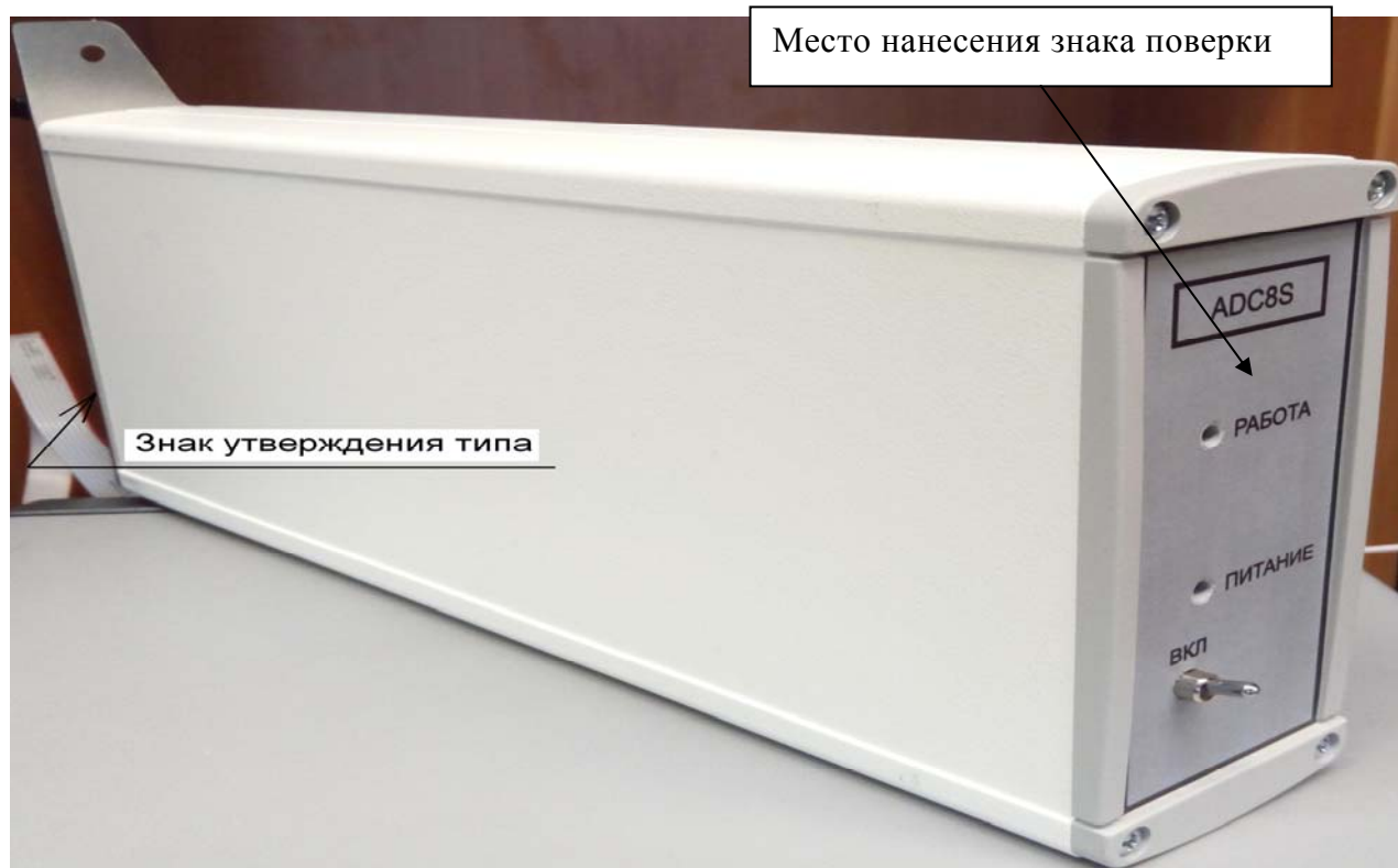
Рисунок 2 - Внешний вид модуля СЕМШ10.1108.00.00