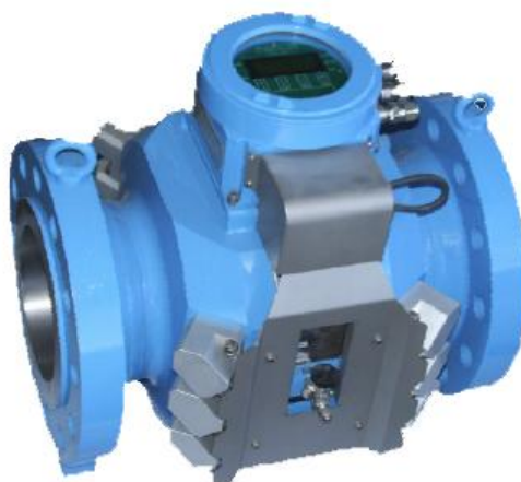
Рисунок 1 - Общий вид счетчика