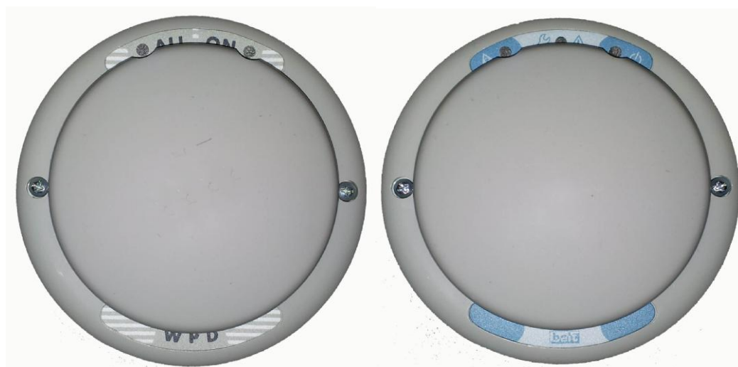
Рисунок 2 - Общий вид датчиков

Элементы настройки измерительной электрической части газосигнализаторов конструктивно защищены пломбой в виде наклейки, которая имеет разрушаемый слой, и при попытке несанкционированного вскрытия повреждается. Схема пломбировки блоков управления и датчиков приведена на рисунках 1 и 3.