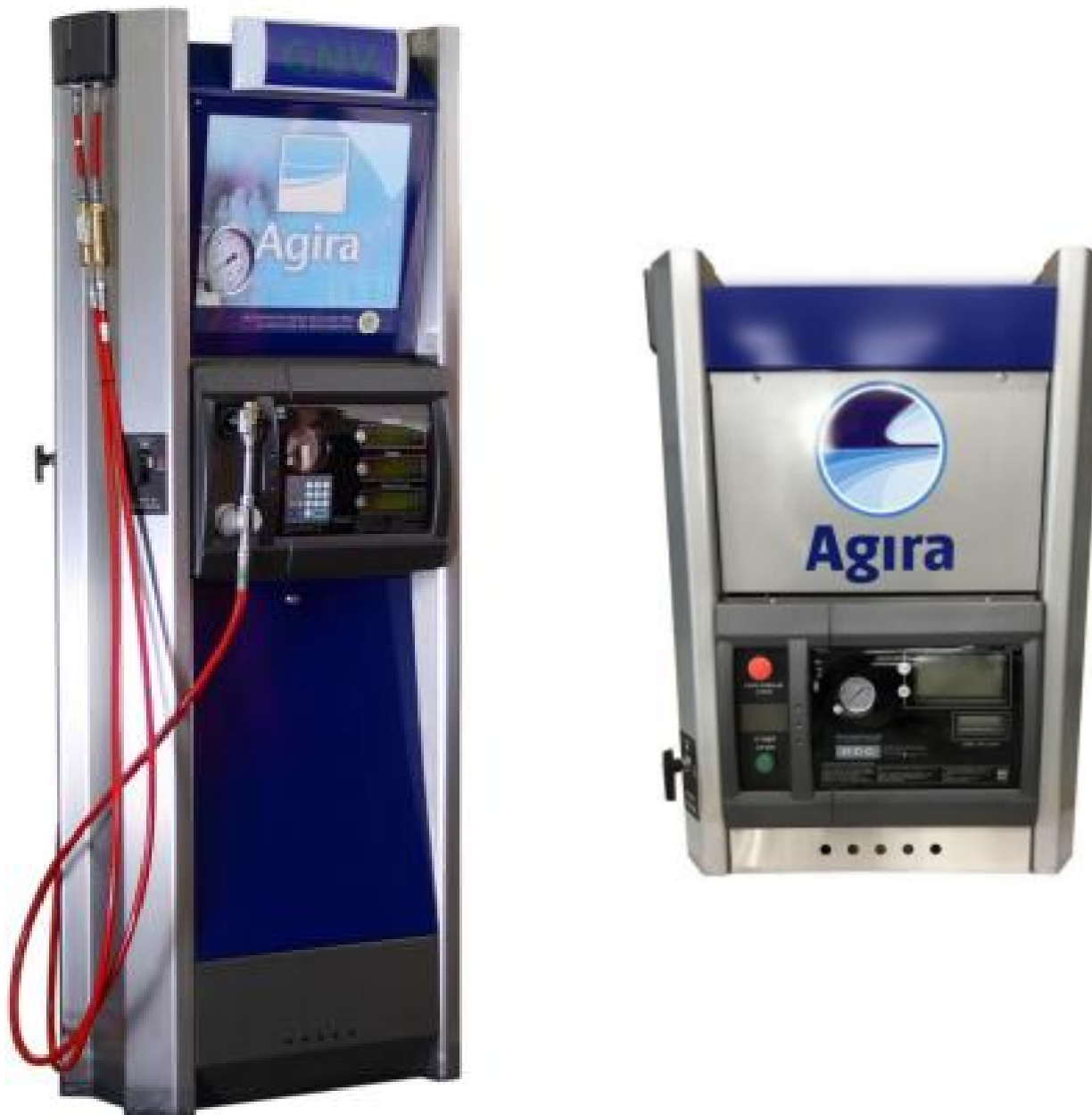
Рисунок 1 - Общий вид колонок заправочных для сжатого природного газа CNG

В колонках пломбируется фиксирующая крышка расходомера, место присоединения расходомера к подводящему патрубку, крепежный винт крышки электронно-вычислительного устройства, либо заглушка на кнопке настройки k-фактора. Схема пломбировки от несанкционированного доступа, обозначение мест нанесения знака поверки представлены на рисунке 2.