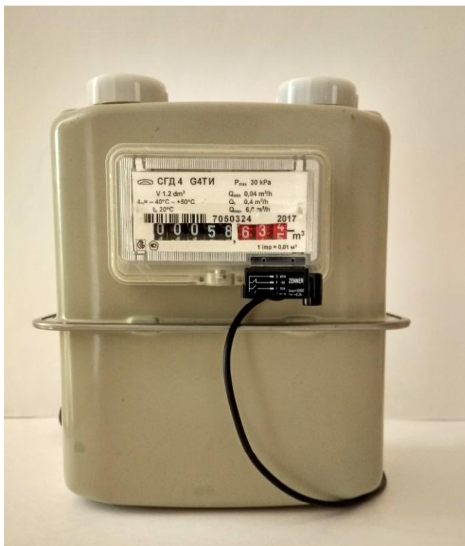
б) Общий вид счетчиков газа СГД 4-х-х-ХИ, СГД 4-х-х-ХТИ