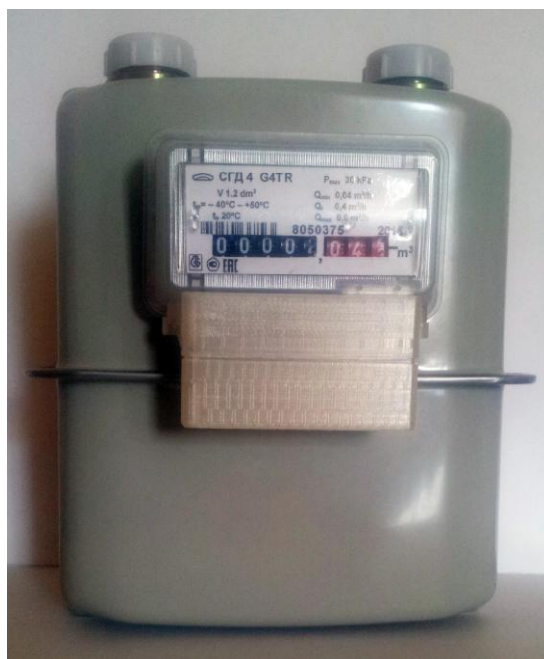
в) Общий вид счетчиков газа СГД 4-х-х-ХР, СГД 4-х-х-ХТР