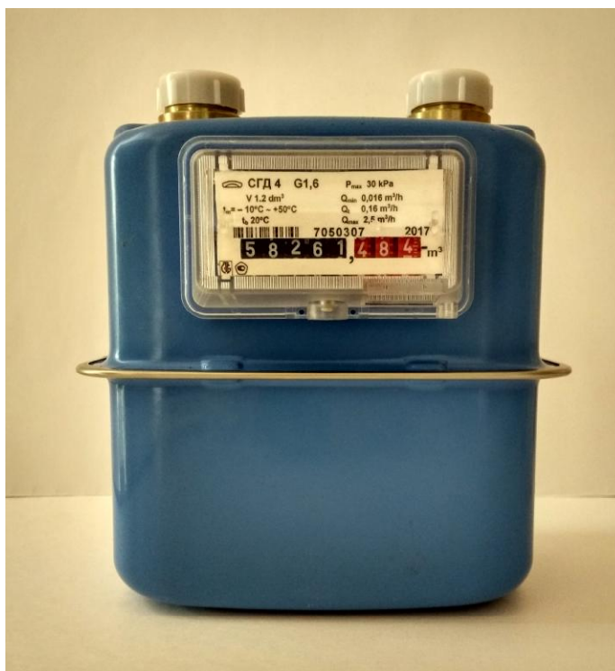
а) Общий вид счетчиков газа СГД 4-х-х-Х, СГД 4-х-х-ХТ

На рисунке 1 приведен общий вид счетчиков.