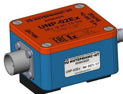
б) общий вид предусилителей «UNP» обычного и взрывозащищенного исполнения