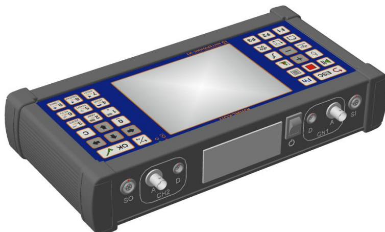
а) общий вид ОПБ «UNISCOP»