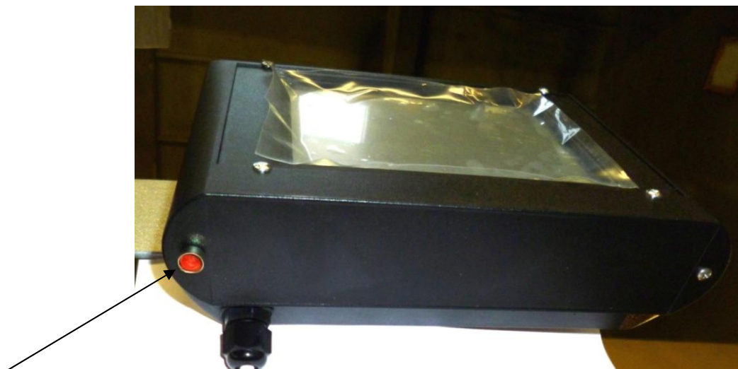
Рисунок 1 – Схема пломбировки микропроцессорного блока управления от несанкционированного доступа