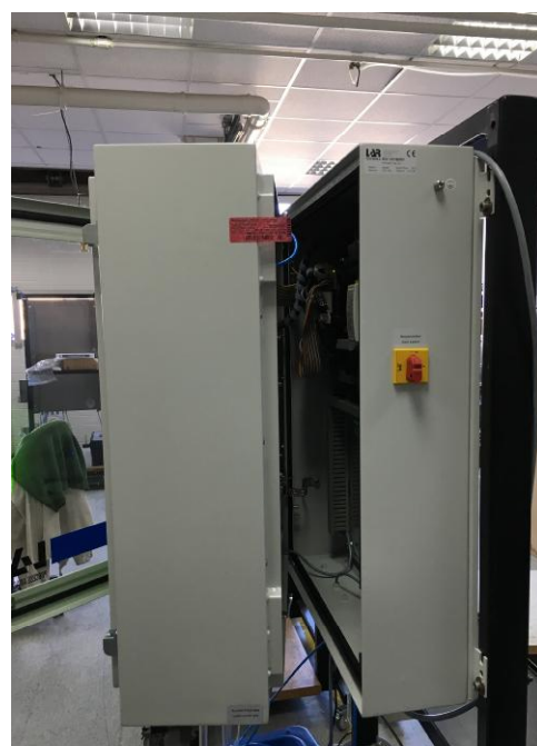
Рисунок 2 - Общий вид анализатора с указанием места пломбирования.