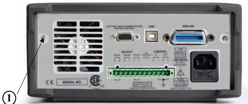
Рисунок 6 - Источник питания 2200-60-2, вид сзади ① - место для нанесения оттиска клейма или размещения наклейки

① - место для нанесения оттисков клейм или размещения наклеек