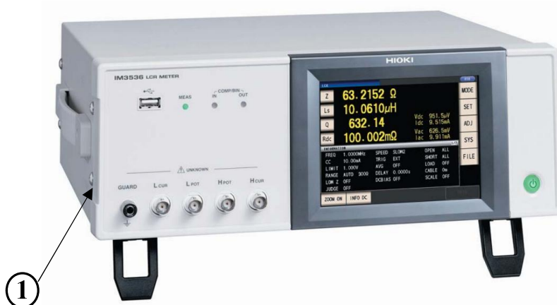
Рисунок 7 – Общий вид измерителя иммитанса IM3536 ① - место для нанесения оттиска клейма или размещения наклейки