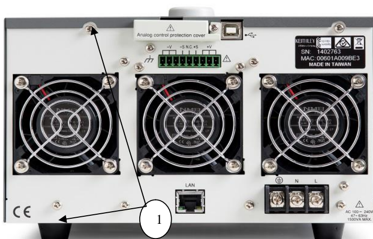
Рисунок 5 - Источник питания 2260B-30-108, вид сзади

① - место для нанесения оттисков клейм или размещения наклеек