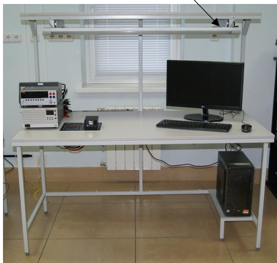
Рисунок 3 - Общий вид АРМ № 3