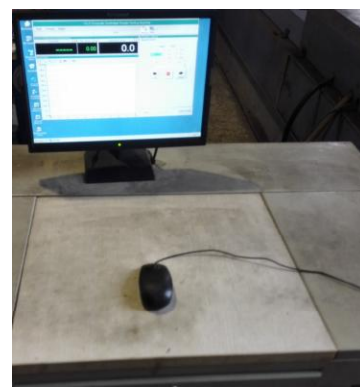
Рабочее место оператора