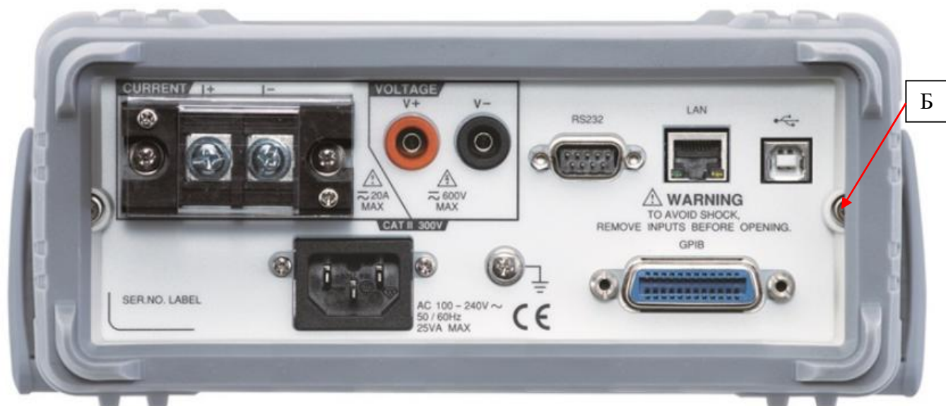
Рисунок 2 – Вид задней панели измерителей и схема пломбировки от несанкционированного доступа (Б)