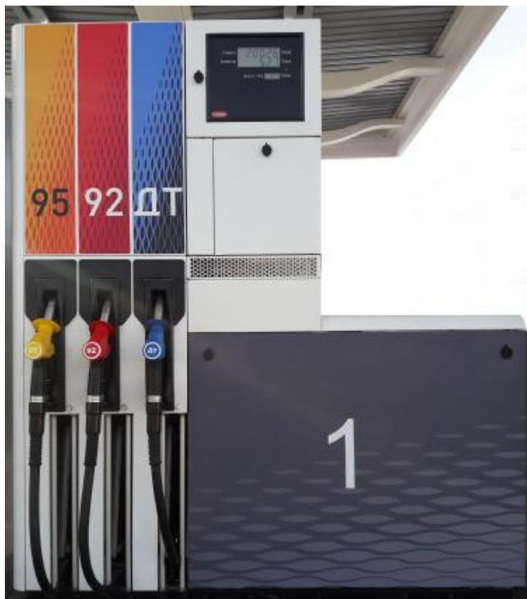
Рисунок 1 . Общий вид колонки

Общий вид колонки приведен на рисунке 1, места пломбирования на рисунках 2 – 3.