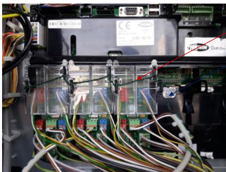
Рисунок 2 - Пломбирование измерителя объема TQM-80