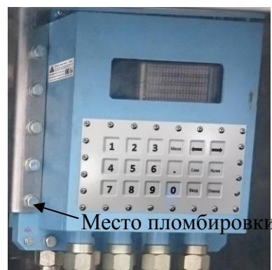
Рисунок 6 – Место пломбировки контроллера «Алкоспот ТР»

Все средства измерения, входящие в состав комплекса, пломбируются в соответствии с технической документацией на них.