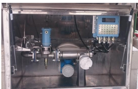
Рисунок 3 – Общий вид комплекса исполнения 1.