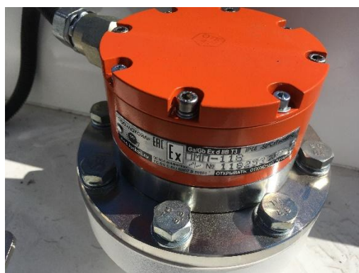
Рисунок 5 - Уровнемер

На рисунках 5 и 6 приведены уровнемер и контроллер «Алкоспот ТР», с местом его пломбировки.