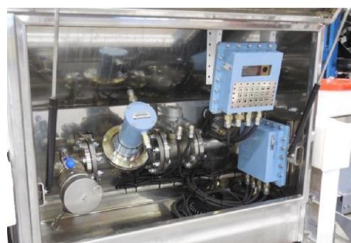
Рисунок 4 – Общий вид комплекса исполнения 2.

На рисунках 5 и 6 приведены уровнемер и контроллер «Алкоспот ТР», с местом его пломбировки.