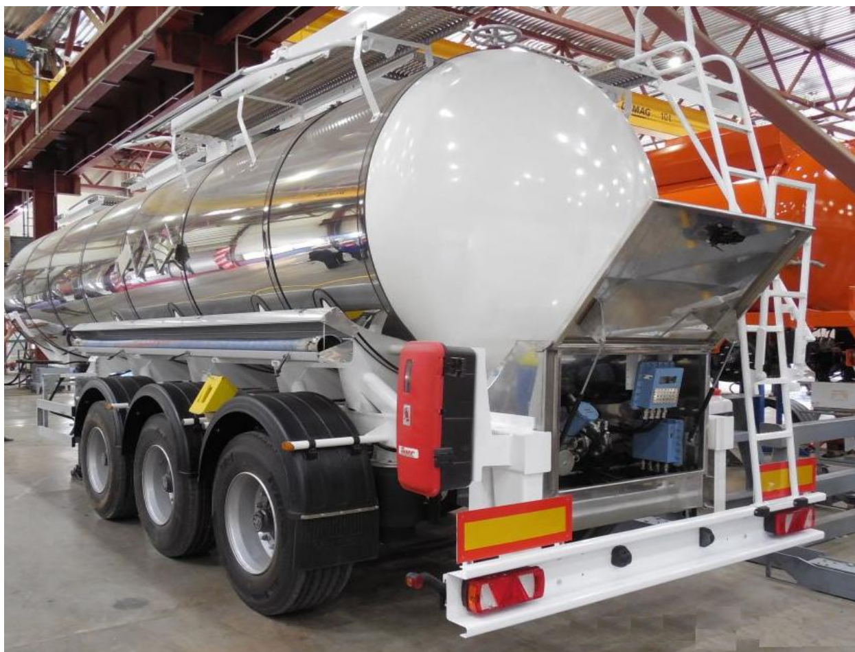
Рисунок 1 – Общий вид комплекса, установленного на автоцистерну

Общий вид комплекса приведен на рисунках 1, 2, 3 и 4.