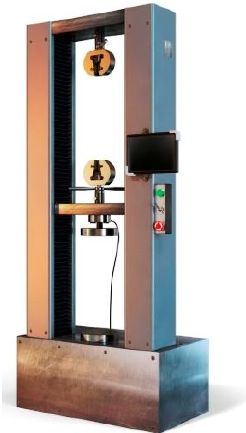
Рисунок 3 - Машины испытательные универсальные серии РКМ исполнений РКМ 5.2, РКМ 10.2, РКМ 20.2, РКМ 50.2, РКМ 100.2 с пультом оператора