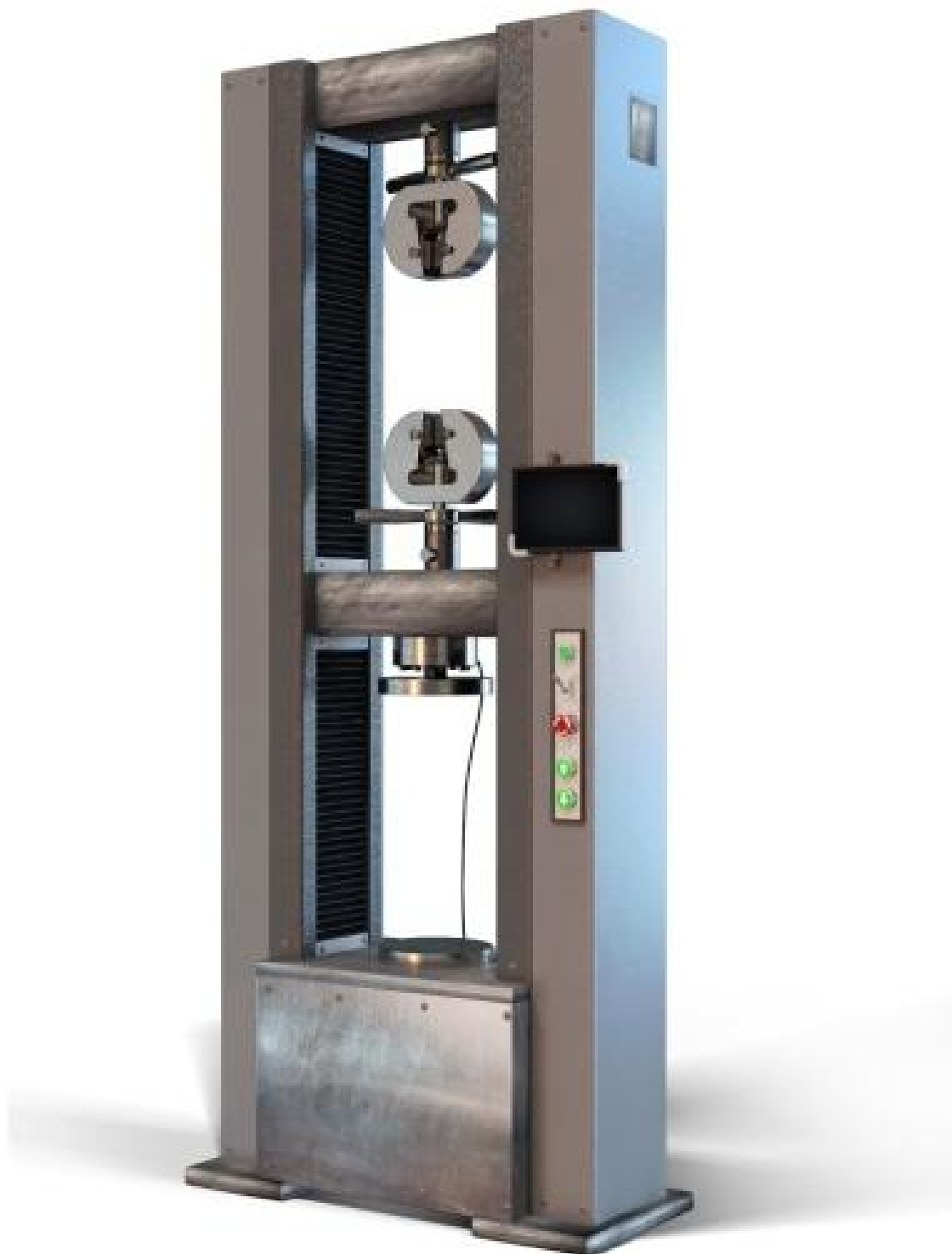
Рисунок 5 - Машины испытательные универсальные серии РКМ исполнений РКМ 200.2, РКМ 300.2, РКМ 500.2, РКМ 600.2 с пультом оператора