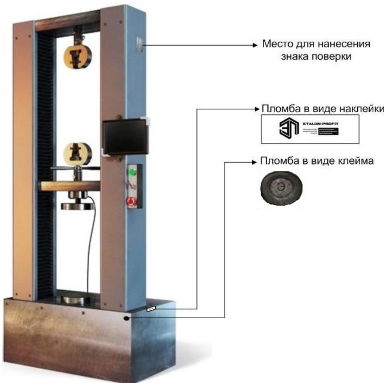
Рисунок 8 - Схема нанесения знака поверки и пломбирования машин серии РКМ исполнений РКМ 5.2, РКМ 10.2, РКМ 20.2, РКМ 50.2, РКМ 100.2 от несанкционированного доступа