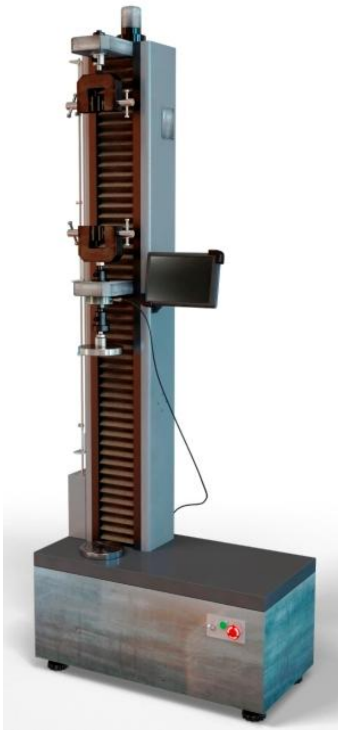
Рисунок 1 - Машины испытательные универсальные серии РКМ исполнения РКМ X.1 с пультом оператора

Общие виды машин серии РКМ исполнений РКМ X.1 и РКМ X.2 представлены на рис. 1-6.