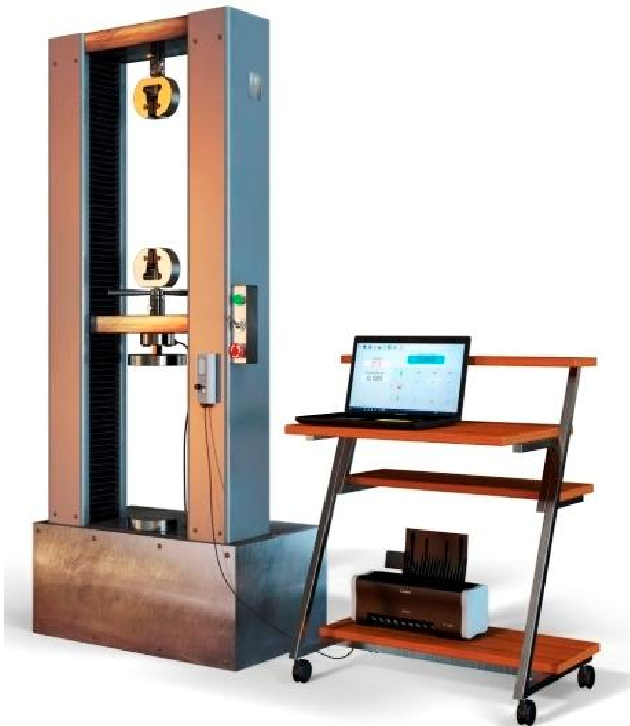
Рисунок 4 - Машины испытательные универсальные серии РКМ исполнений РКМ 5.2, РКМ 10.2, РКМ 20.2, РКМ 50.2, РКМ 100.2 с ПТК