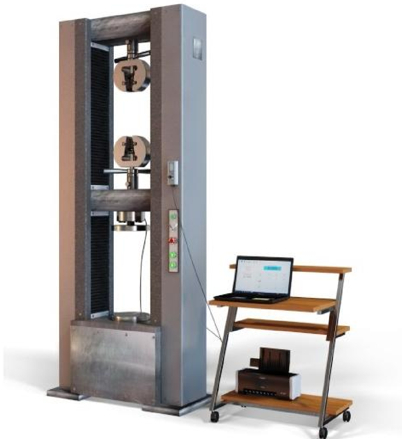
Рисунок 6 - Машины испытательные универсальные серии РКМ исполнений РКМ 200.2, РКМ 300.2, РКМ 500.2, РКМ 600.2 с ПТК