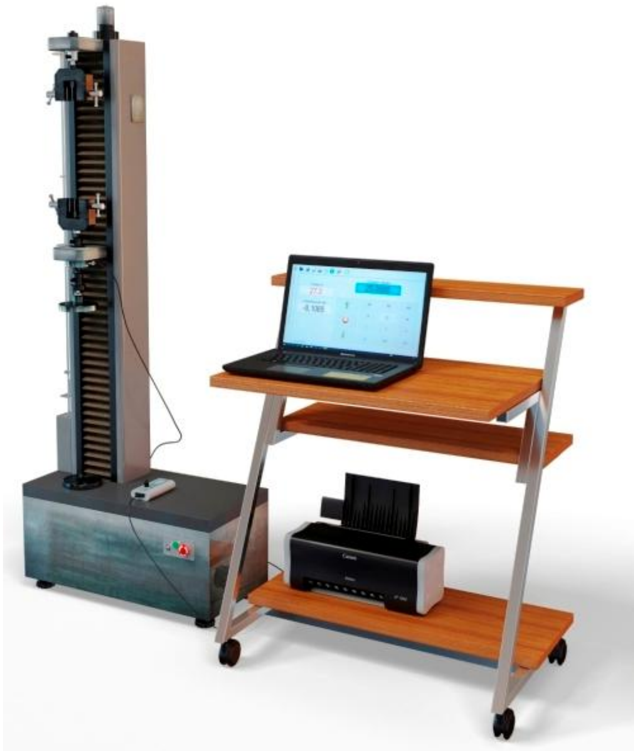
Рисунок 2 - Машины испытательные универсальные серии РКМ исполнения РКМ X.1 с ПТК