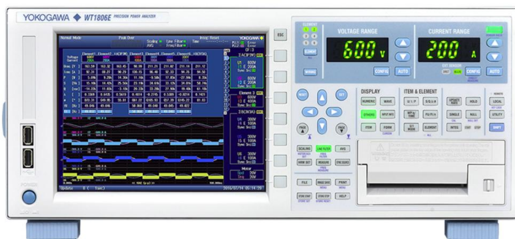
Рисунок 1 - Вид передней панели

Пломбирование измерителей не предусмотрено. Фотографии общего вида измерителей приведены на рисунках 1-2.