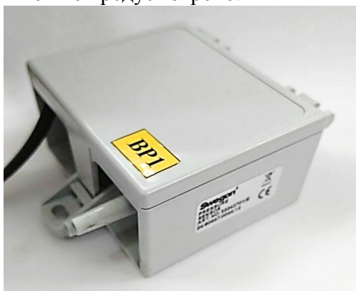
Рисунок 1 – Общий вид датчика

Пломбирование датчиков не предусмотрено.