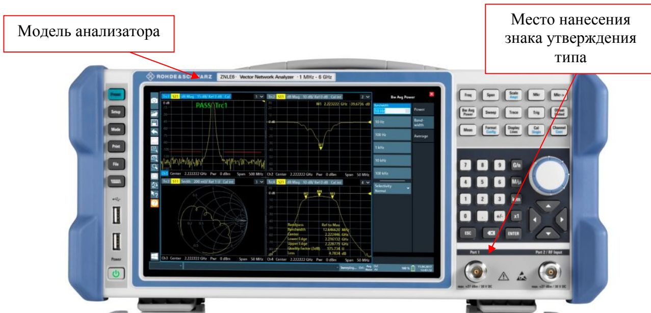
Рисунок 1 - Общий вид средства измерений