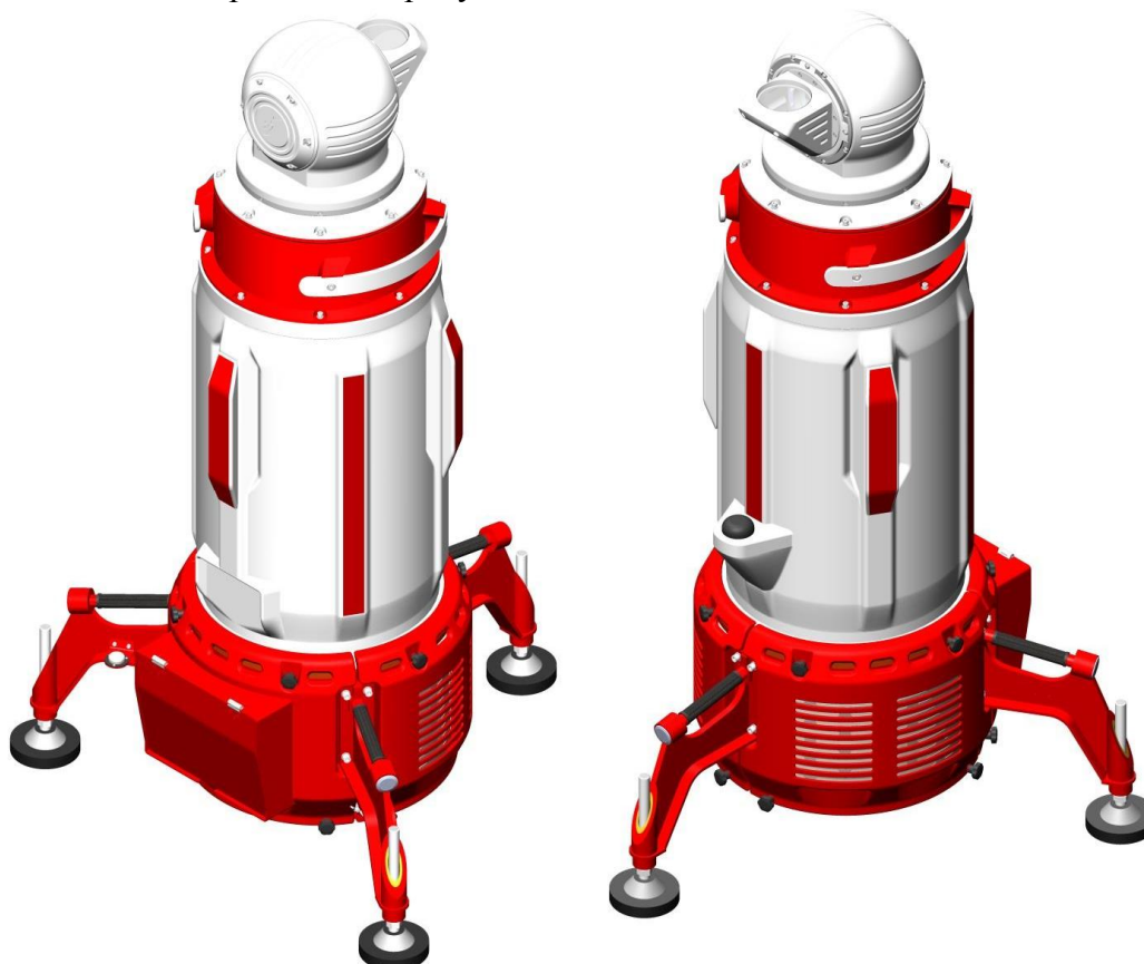
Рисунок 1 – Общий вид ИВЛ

Конструктивно ИВЛ состоит из трех основных модулей (рисунок 2):