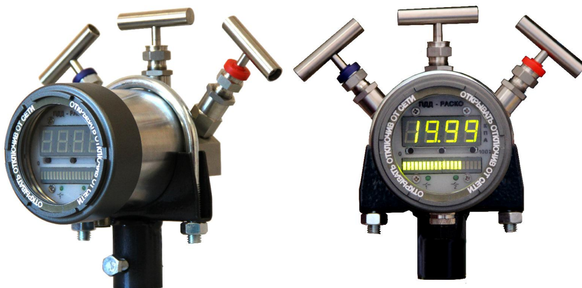
Рисунок 2 – Общий вид преобразователей разности давлений измерительных ПДД-РАСКО исполнение жидкокристаллическим дисплеем.