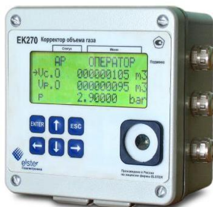
Рисунок 1 - Общий вид корректора объема газа ЕК270

Схема пломбировки от несанкционированного доступа, обозначение мест нанесения знака поверки приведены на рисунке 2.