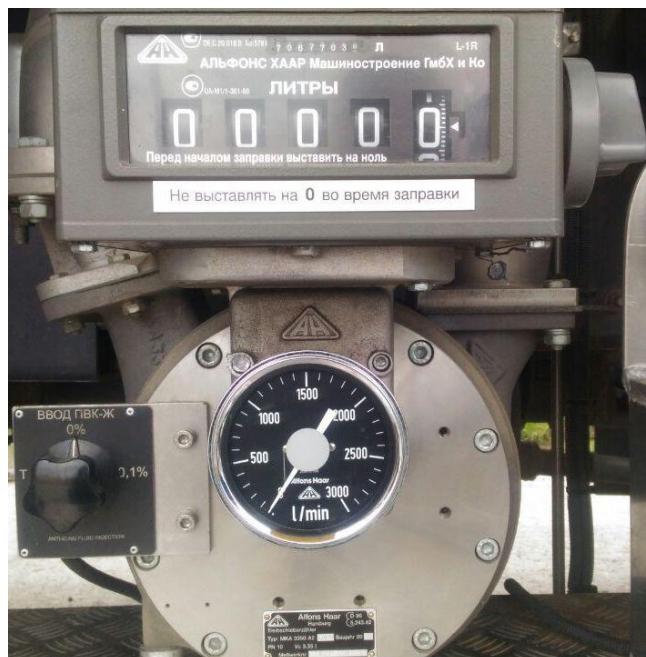
Р и с у н о к 1 – Общий вид средства измерений