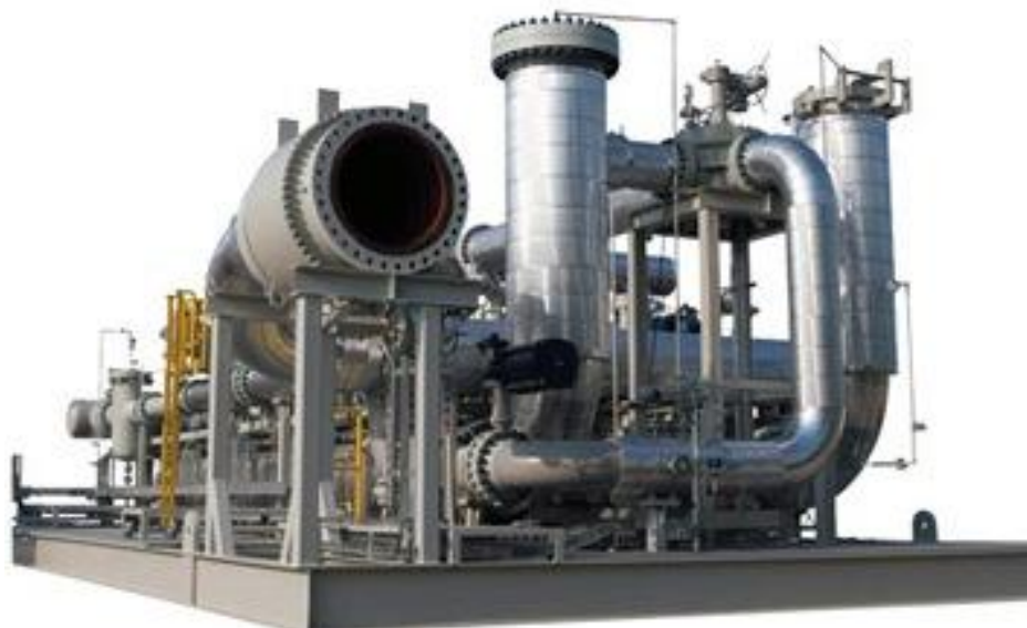
Рисунок 1 - Установка поверочная трубопоршневая двунаправленная

ТПУ состоит из следующих основных частей, смонтированных на стальной сварной раме (полураме): корпуса с калиброванным и разгонными участками, шарового поршня, детекторов положения поршня (далее - детекторов), четырехходового переключающего клапана, средств измерений давления и температуры, электрического или гидравлического привода. ТПУ является стационарной установкой и представлен на рис. 1.