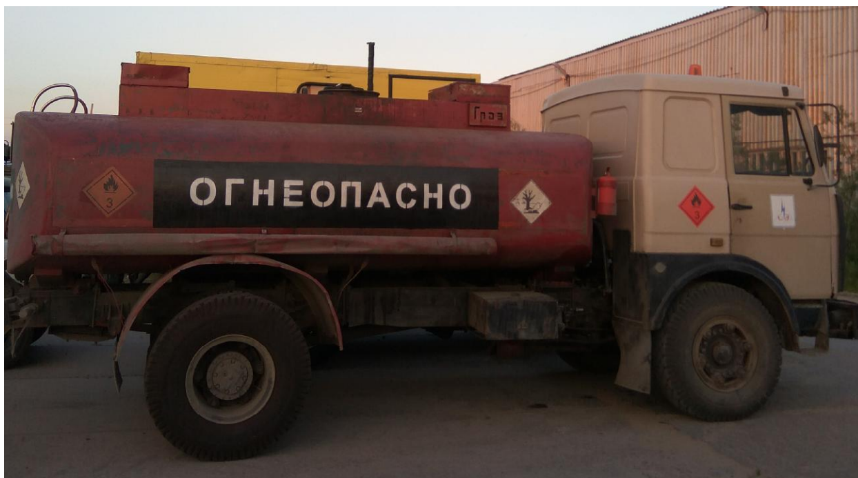
Рисунок 1 - Общий вид автотопливозаправщика АТЗ-11

Общий вид автотопливозаправщика АТЗ-11 с заводским номером 1740 представлен на рисунке 1.