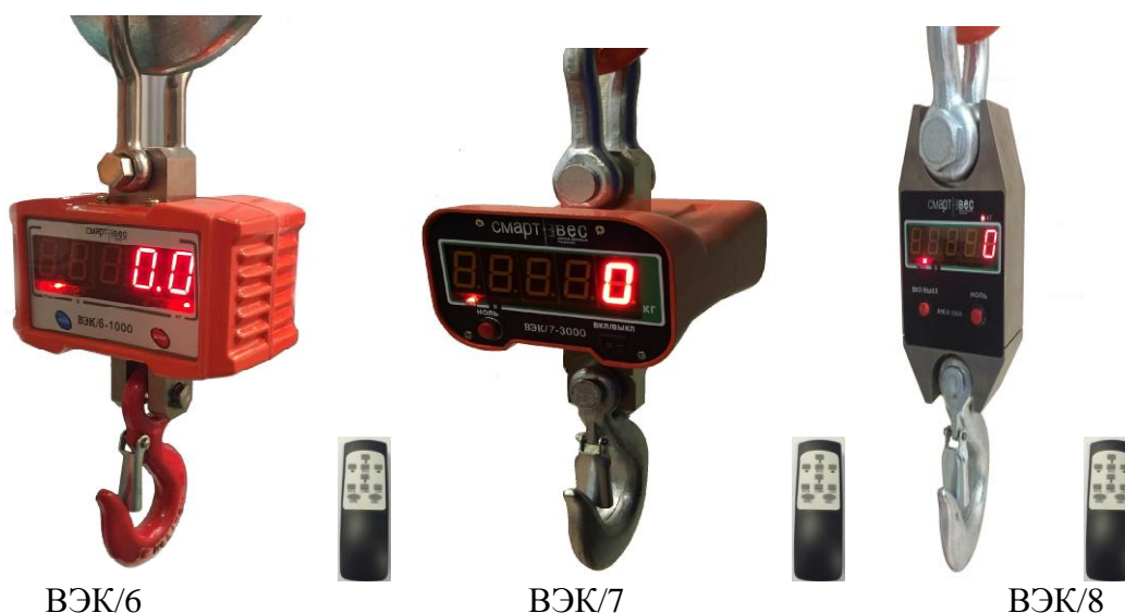
Рисунок 1 – Общий вид весов в зависимости от варианта исполнения

Мах – максимальная нагрузка, указанная в килограммах.