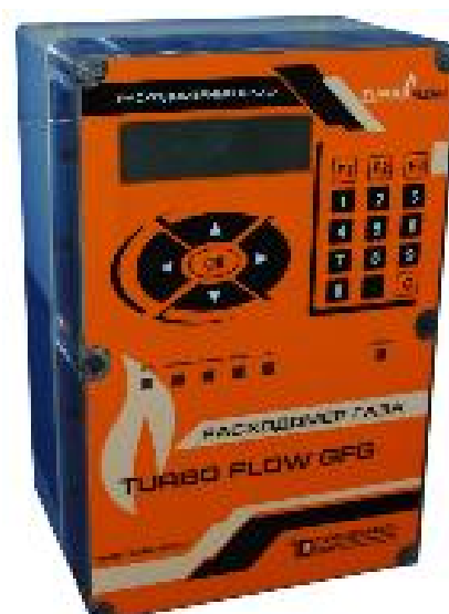
б) Внешний терминал расходомера Turbo Flow GFG-F