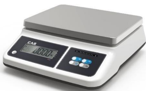
Модификация PRП-X1CD с жидкокристаллическим показывающим устройством