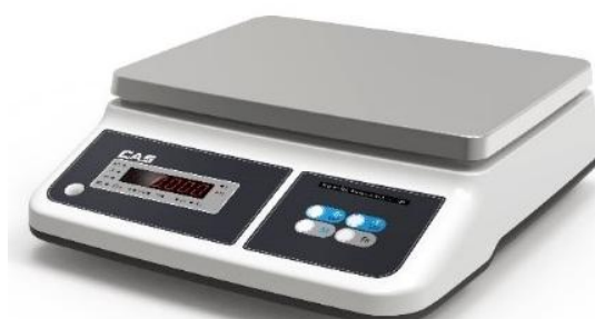
Модификация PRП-X1ED со светодиодным показывающим устройством