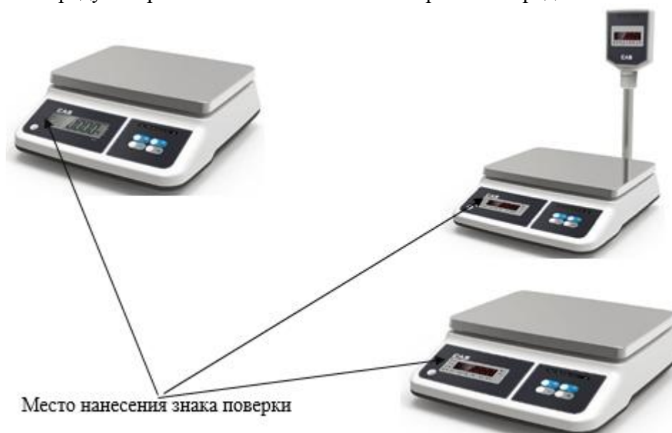
Рисунок 3 – Место нанесения знака поверки на весах PRII-D

Для весов PRII-D знак поверки в виде разрушаемой наклейки наносится на лицевую панель весов (рисунок 3). Для весов PDC знак поверки наносится на свидетельство о поверке, т.к. конструкция весов не предусматривает нанесение знака поверки непосредственно на весы.