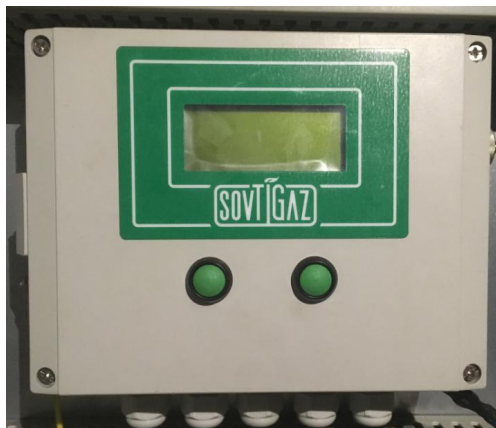
а) вычислители, установленные в шкафу

Общий вид средства измерений представлен на рисунке 1.