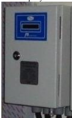
а) вычислитель, установленный в шкафу

Общий вид комплекса представлен на рисунке 1.