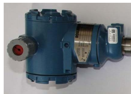
в) преобразователь давления