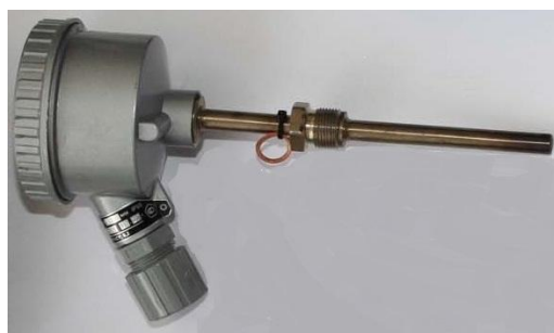
б) преобразователь температуры