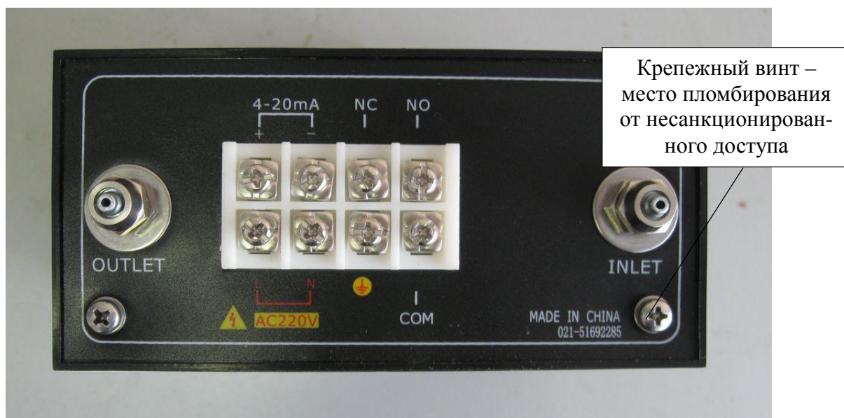
Рисунок 2 – Схема пломбирования газоанализаторов (на примере GNL-2100)