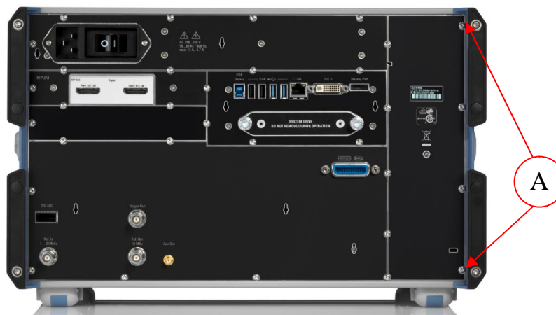
Рисунок 2 - Схема пломбировки от несанкционированного доступа (А)