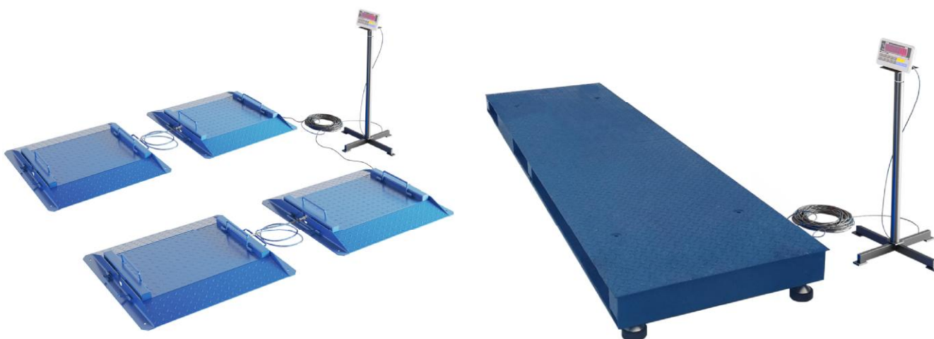
Рисунок 1 - Фотографии весов

Фотографии весов представлены на рисунке 1.