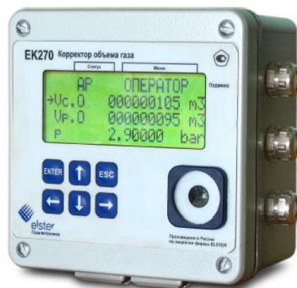
Рисунок 1 – Общий вид корректора объема газа ЕК270

Схема пломбировки от несанкционированного доступа, обозначение мест нанесения знака поверки, приведены на рисунке 2.