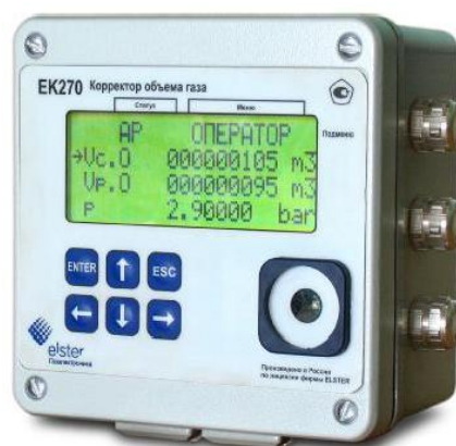
Рисунок 1 – Общий вид корректора объема газа ЕК270

Схема пломбировки от несанкционированного доступа, обозначение мест нанесения знака поверки, приведены на рисунке 2.