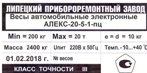
Рисунок 2 - Образец маркировочной таблички

Образец маркировочной таблички представлен на рисунке 2.