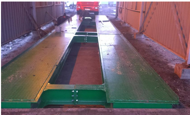
Рисунок 1 - Внешний вид весов АЛЕКС колейного исполнения

Внешний вид весов представлен на рисунке 1.