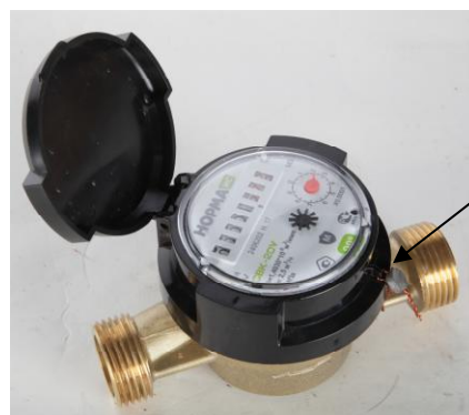
Рисунок 2 – Общий вид счетчиков СВКМ DN 15 имеющих специальное разъемное кольцо для пломбировки