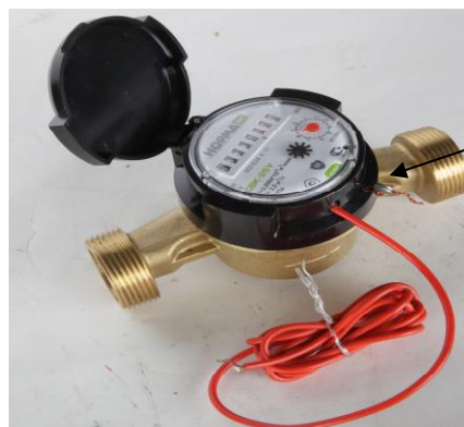
Рисунок 3 – Общий вид счетчиков СВКМ DN 20 - 50