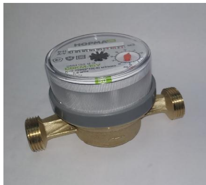
Рисунок 1 – Общий вид счетчиков СВКМ DN 15