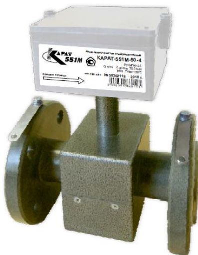
Рисунок 1 – Общий вид расходомеров-счетчиков электромагнитных КАРАТ-551М