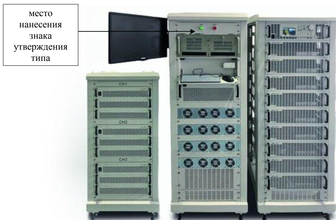
Рисунок 1 – Общий вид средства измерений модификации 8300-80/500-ТЕСТ

Общий вид средства измерений представлен на рисунках 1-3.