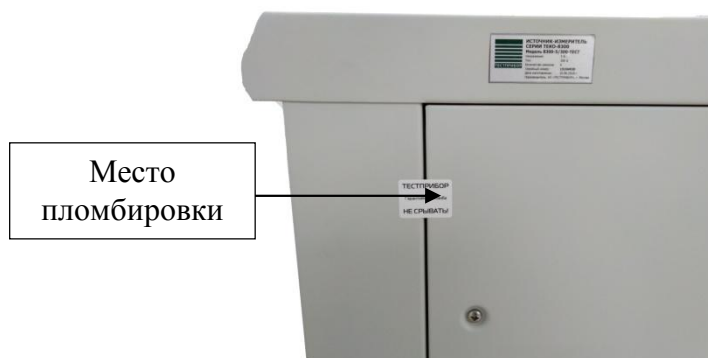
Рисунок 4 – Пломбировка приборов от несанкционированного доступа