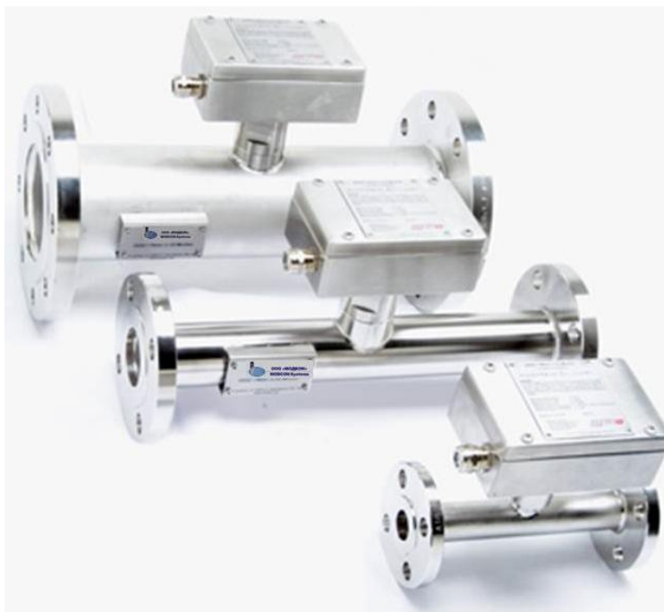
Рисунок 1 - Анализаторы влажности нефти и масел поточные EASZ-1

Общий вид влагомера представлен на рисунке 1. Схема пломбирования от несанкционированного доступа представлена на рисунке 2.