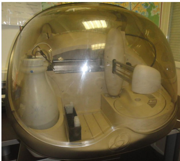
Рисунок 1 – Общий вид анализатора Random Access A15

Исполнения Random Access A15 и Random Access A25 отличаются производительностью, мощностью потребляемого тока, комплектацией, габаритами и внешним видом.