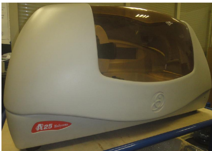
Рисунок 2 – Общий вид анализатора Random Access A25