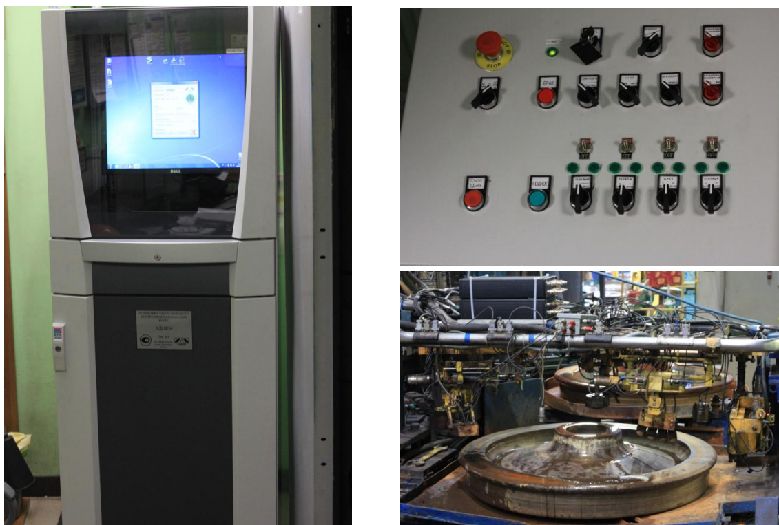
Рисунок 1 – Общий вид установки

Общий вид установки представлен на рисунке 1.