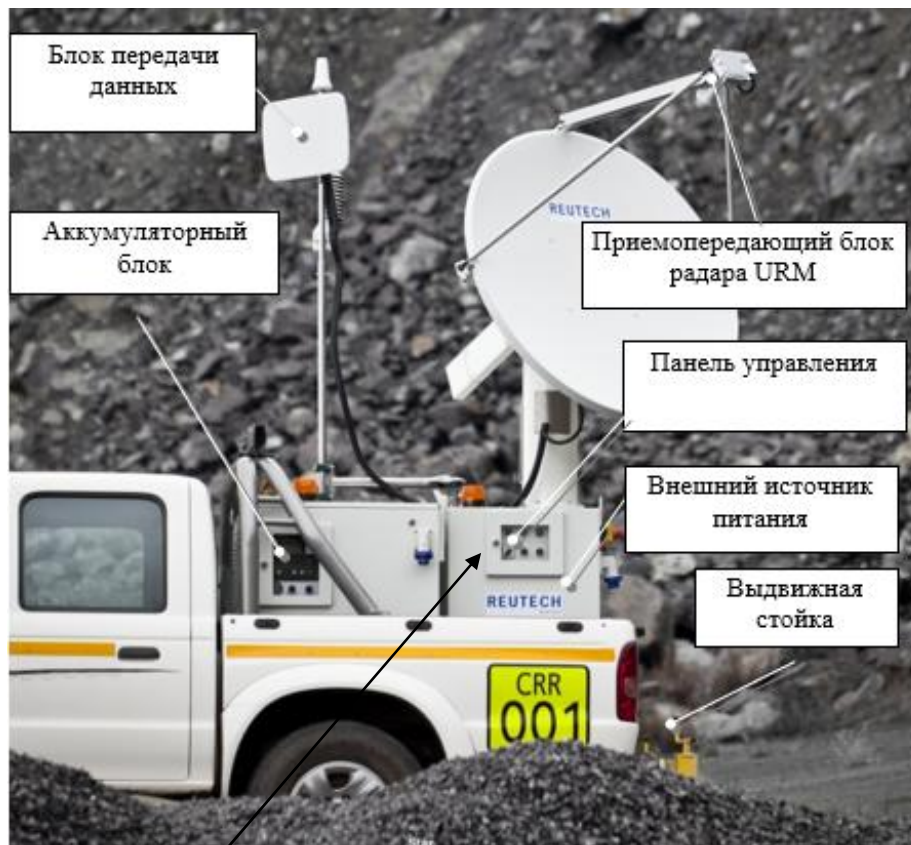
б - место нанесения наклейки со знаком утверждения типа Рисунок 3 – Общий вид системы MSR 300 rev B справа с указанием основных элементов и указанием места нанесения знака утверждения типа