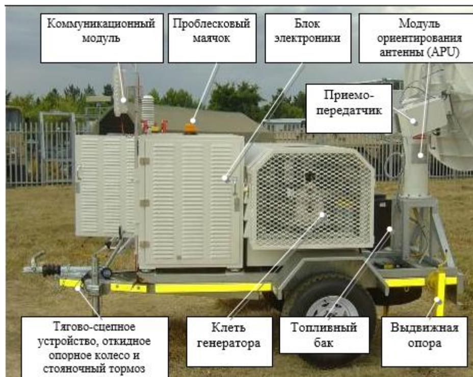
Рисунок 1 – Общий вид системы MSR 300 справа с указанием основных элементов