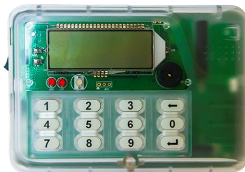
Рисунок 3 – Общий вид индикаторного устройства