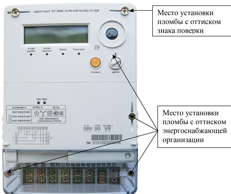
Рисунок 1 – Общий вид счетчика непосредственного включения в корпусе типа W

Схема пломбировки от несанкционированного доступа, обозначение мест нанесения знака поверки представлены на рисунках 1 – 2.