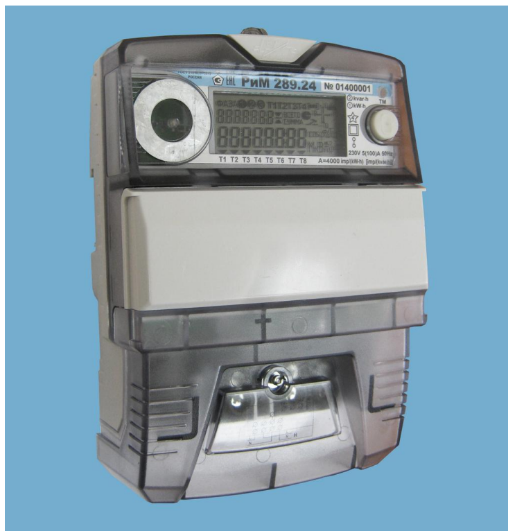
Рисунок 1 – Общий вид счетчиков РиМ 289.2Х