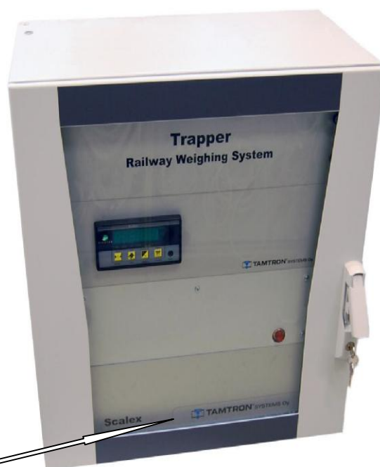
Шкаф электроники с блоком Scalex 2200