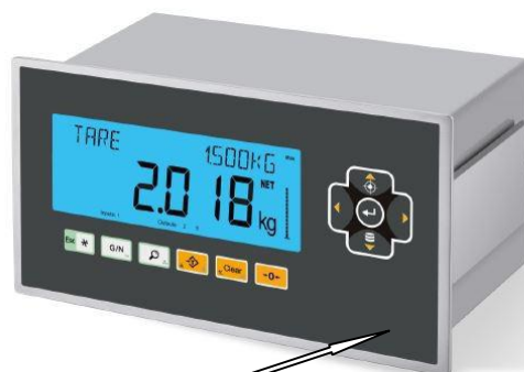
Места нанесения знака поверки