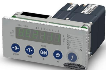
Места нанесения знака поверки