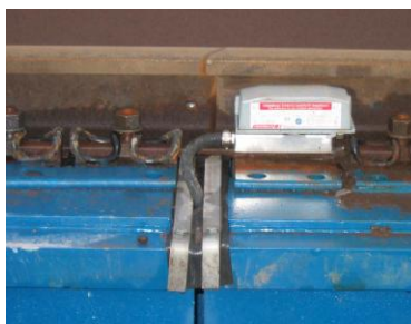
Рисунок 2 – Общий вид датчика счета осей