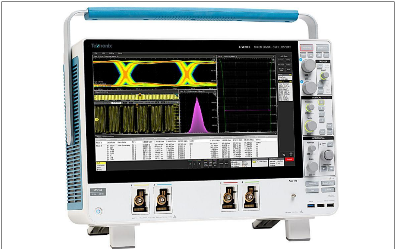
Рисунок 1 – Общий вид осциллографов