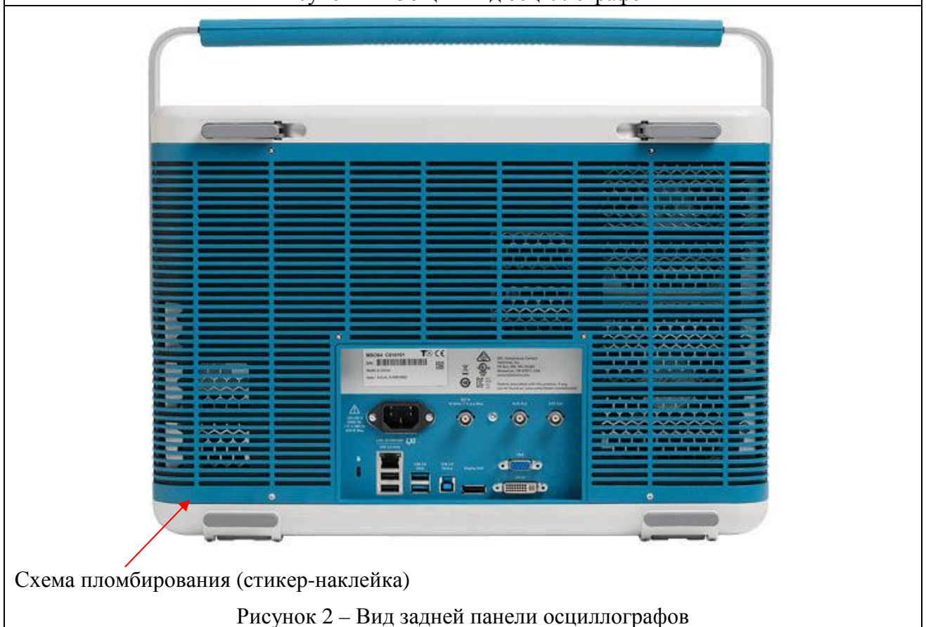
Схема пломбирования (стикер-наклейка)