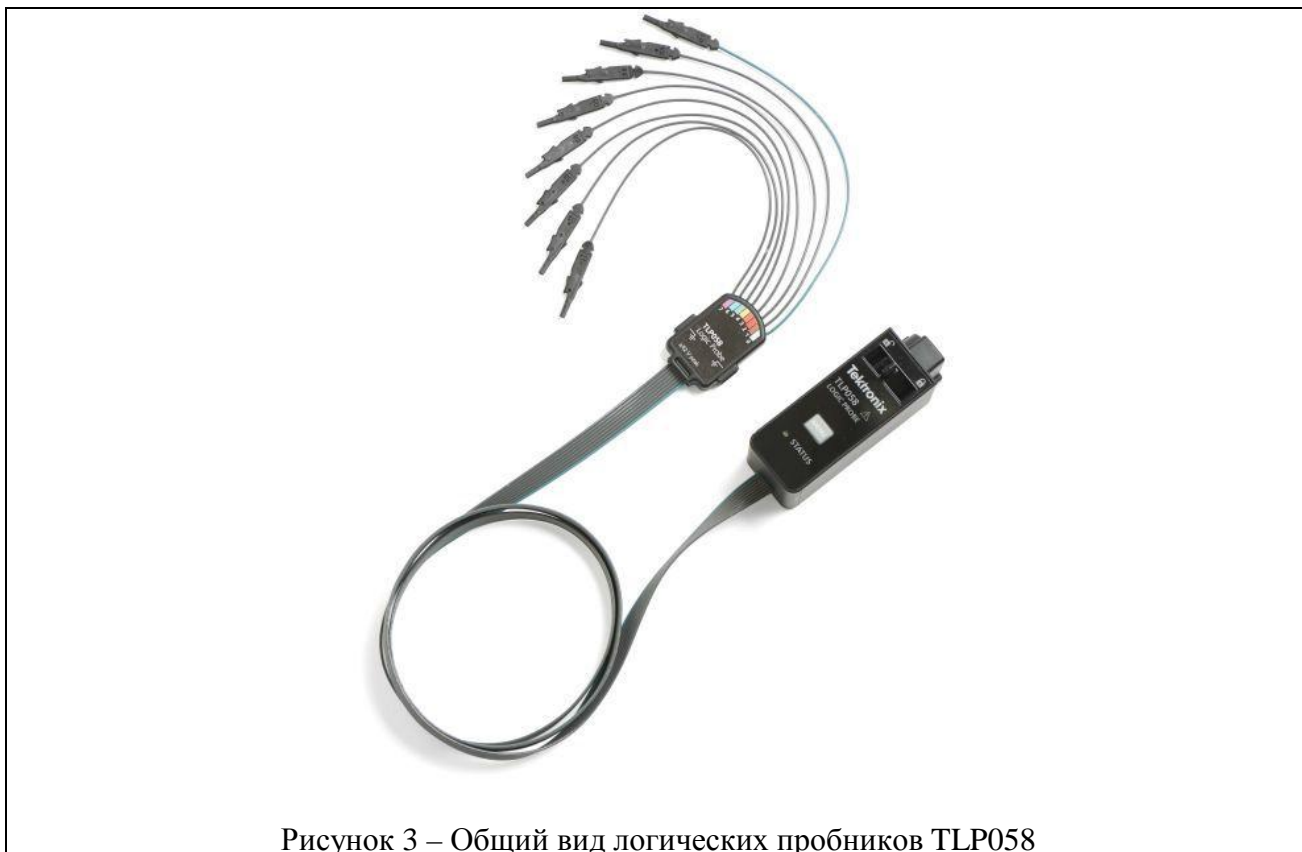
Рисунок 3 – Общий вид логических пробников TLP058